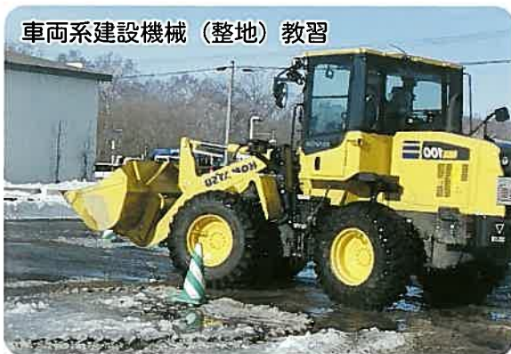
車両系建設機械（整地）教習