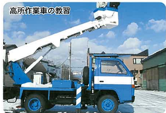
高所作業車の教習