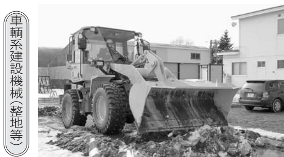
車輻系建設機械(整地等)