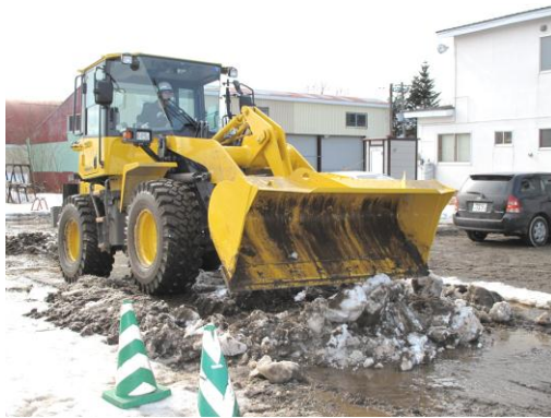
車輛系建設機械(整地等)